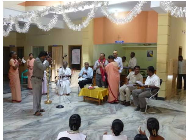
Celebración del 1er Aniversario de la inauguración del Hospital