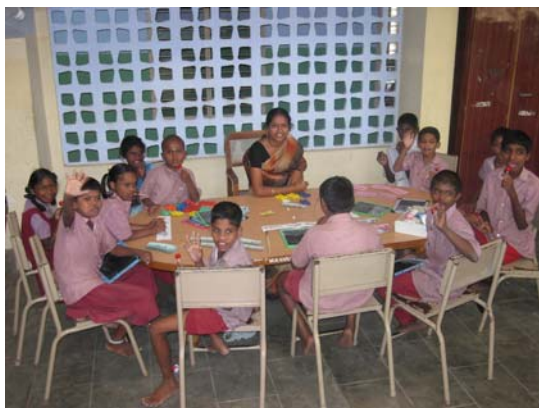
Grupo de niños en la Escuela del Orfanato