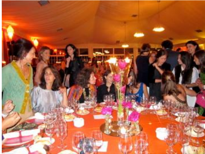
Vista de una de las mesas