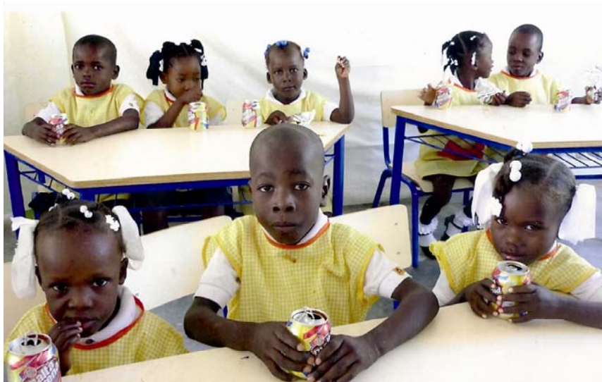
Niños de la Escuela “Ciudad de la Esperanza y Alegría” construida por las Hermanas Carmelitas Vedrunas.

Por otro lado, las Hijas de la Caridad de San Vidente de Paul nos solicitaron ayuda económica para dar de comer diariamente a miles de personas que acudían al comedor improvisado que levantaron en el barrio de Cité de Soleil, el más pobre de Puerto Príncipe, la Capital de Haití. Gracias a este programa de ayuda, muchas familias pudieron sobrevivir a esta tragedia, en la que perdieron todo.