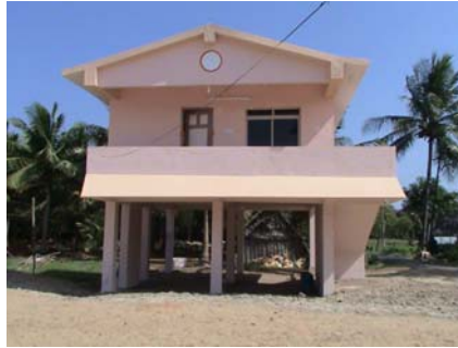
Casita para alojar a los voluntarios que van a Kameswaram